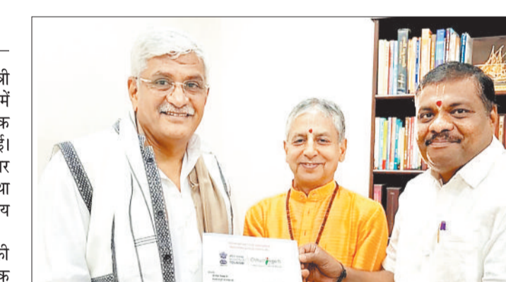
केन्द्रीय पर्यटन एवं संस्कृति मंत्री से मुलाकात करते जनप्रतिनिधि।