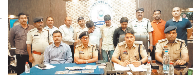
चोर गिरोह का पर्दाफाश करते पुलिस के अफसर।