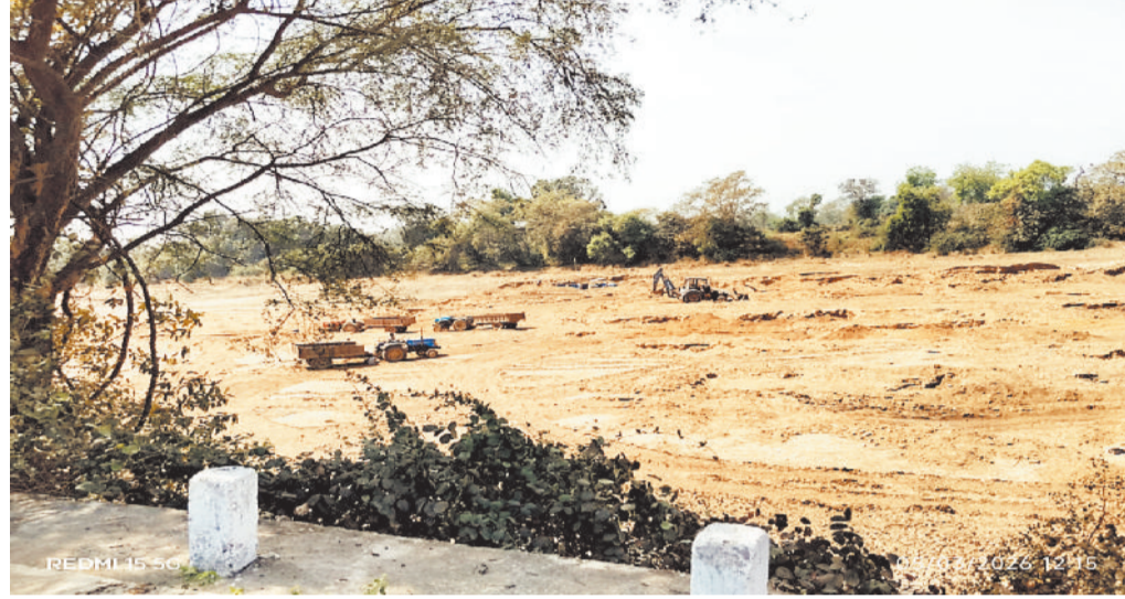
इस तरह से होता है रेत का अवैध उत्खनन व परिवहन।

सक्ती जिले में सक्रिय रेत माफिया महानदी, सोन व बोराई नदी का सीना छलनी कर रहे हैं। यहां मशीनों से रेत का अवैध उत्खनन व परिवहन घड़ल्ले से हो रहा है। ऐसा भी नहीं है कि इस दिशा में प्रशासन व विभाग द्वारा कार्रवाई नहीं की जा रही हो, बावजूद इसके यह कारोबार हो रहा है।