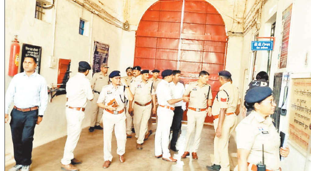
जिला जेल का निरीक्षण करने पहुंचे अपर कलेक्टर एवं एसडीशनल एसपी की संयुक्त टीम।